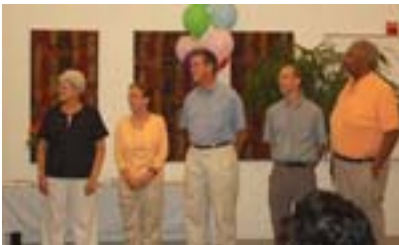
Miembros de la junta directiva en 2007

La Asamblea Anual de la Cooperativa Latina tendrá lugar el 10 de mayo. Habrá música, bailes típicos y comida. Además, como informamos en la noticia anterior, la asamblea coincide con la graduación de